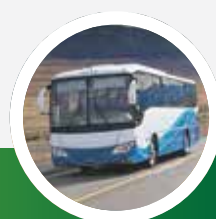
OCHRONA FIRM TRANSPORTOWYCH