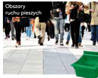
Obszary ruchu pieszych