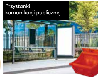
Przystanki komunikacji publicznej